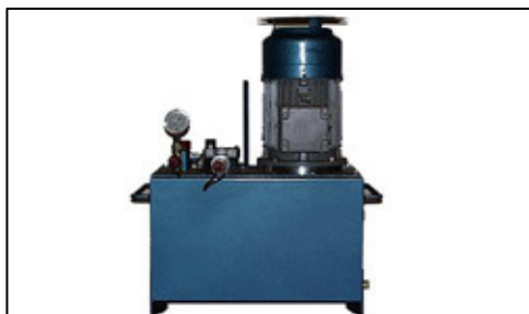
Hydraulik aggregat med elektrisk motor